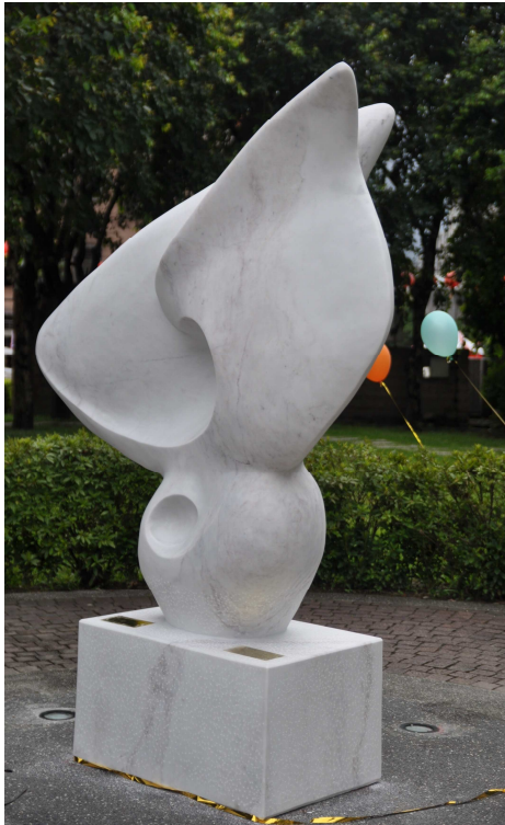
圖一 「朝陽」王俠軍 2011